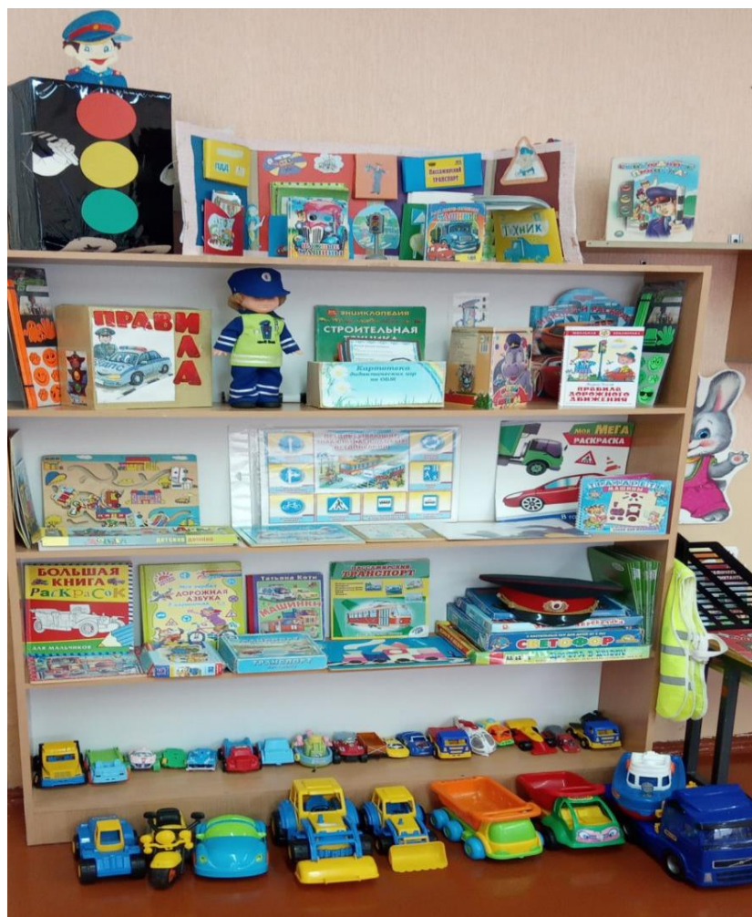
В коридоре ДОУ.